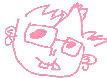
赤 沢 早 人 (奈良教育大学)